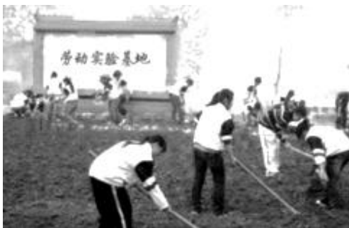
图片一：绿地学校开展劳动实践活动