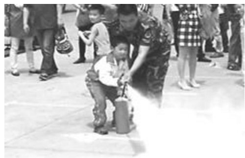
图片二：绿魁社区组织未成年人消防演练